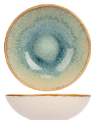
SCHAAL 15,5 CM