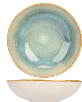
SCHAAL 24,5 CM