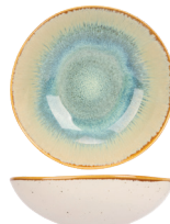
SCHAAL 20 CM