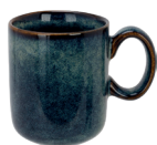
TASSE 17 CL