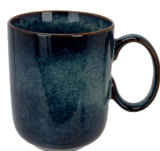
BECHER 39 CL